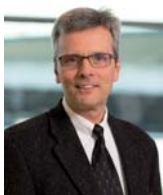
Volker Scheel Innung Berlin